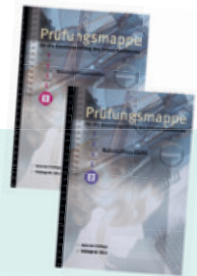
Bild 3 Prüfungsmappe des Zentralverbands des Deutschen Friseurhandwerks, Köln