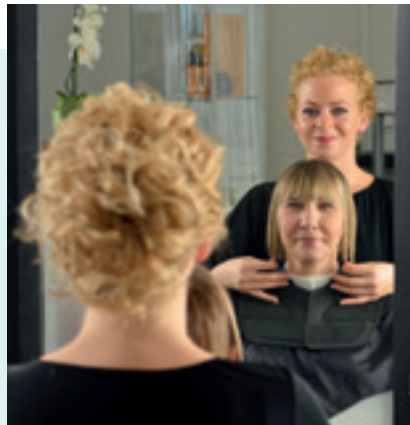
Bild 2 Friseurin im Umgang mit der Kundin